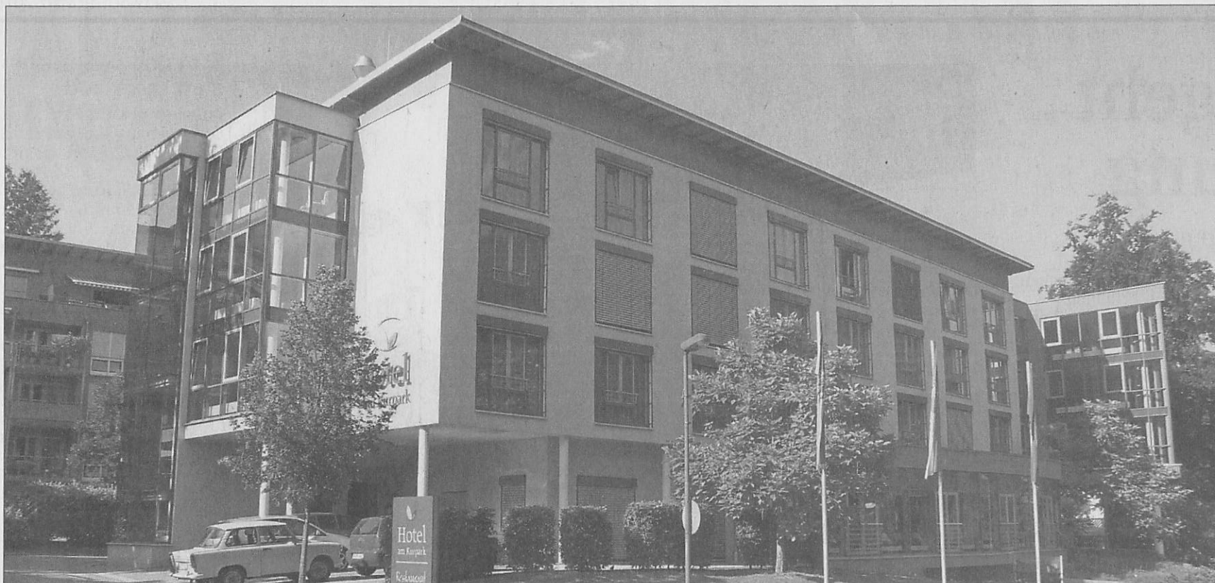
Das Hotel am Kurpark wurde bislang als barrierefreie Einrichtung auf Vier-Sterne-Niveau betrieben.